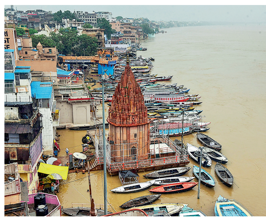
Boats anchored along a flooded bank of River Ganga following heavy rainfall in Varanasi on Wednesday.